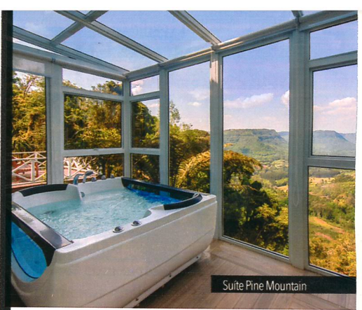
Suite Pine Mountain